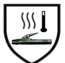
Resistente a Temperaturas