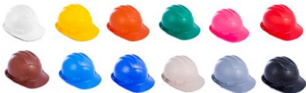
opções de cores