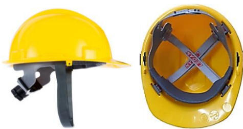
suspensão com catraca suspensão simples