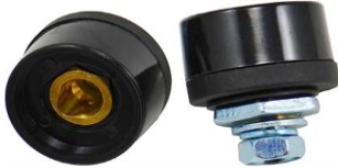
Conector de Painel Fêmea