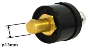
Conector de Painel com Plug Macho