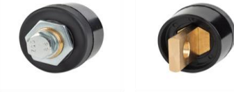
CONECTOR MACHO OLHAL PAINEL

Conector para painel de inversora de solda para maior desempenho e estabilidade na condutividade elétrica durante o processo de solda, proporciona uma conexão precisa, rápida e segura, utilizados em máquinas de solda para conexão do cabo terra (Garra Negativa) e Porta Eletrodo, como também pode ser usado em montagem de painéis elétricos para conexão de cabos de grandes bitolas.